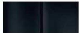
Черная (Noir Onyx)