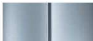
Серая (Gris Aluminium)