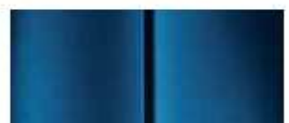
Синяя (Bleu Kyanos)