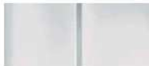
Белая (Blanc Banquise)