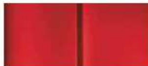
Красная (Rouge Ardent)