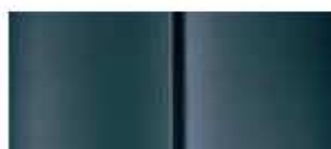
Серая (Gris Fer)