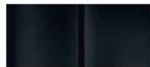
Черная (Noir Onyx)