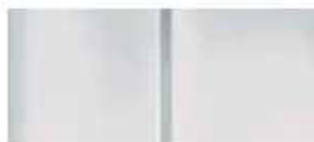
Белая (Blanc Bonquise)