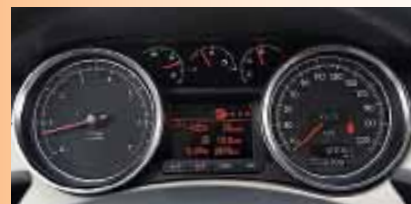
▲ Стильные приборы не портит даже простенький дисплей бортового компьютера