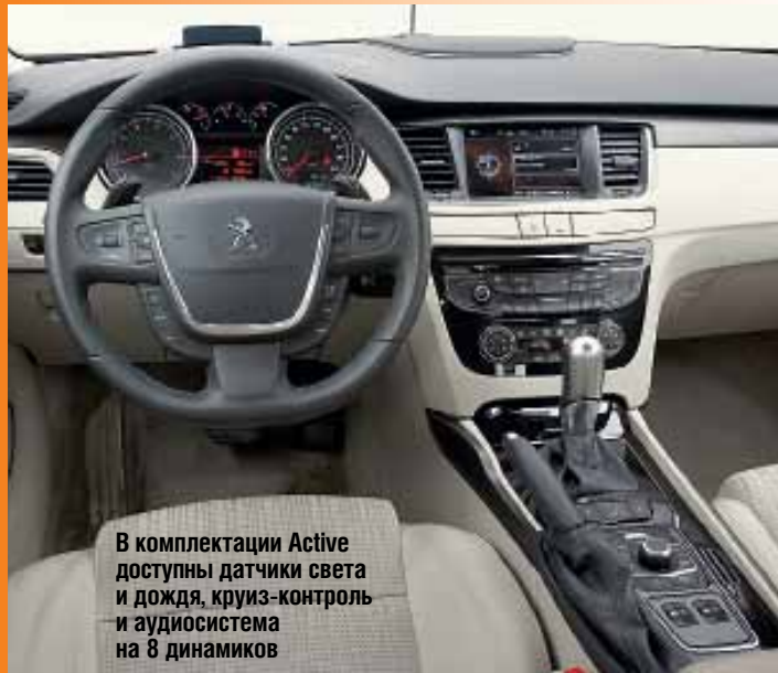
В комплектации Active доступны датчики света и дождя, круиз-контроль и аудиосистема на 8 динамиков