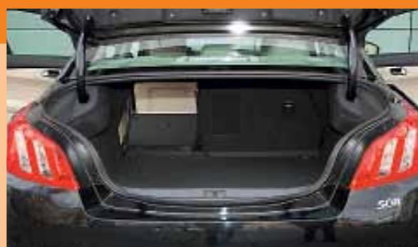
▲ Зауженный проем — результат победы дизайна над функциональностью ◀ Инструмент первой необходимости поселился в нише диска полноразмерной «запаски»