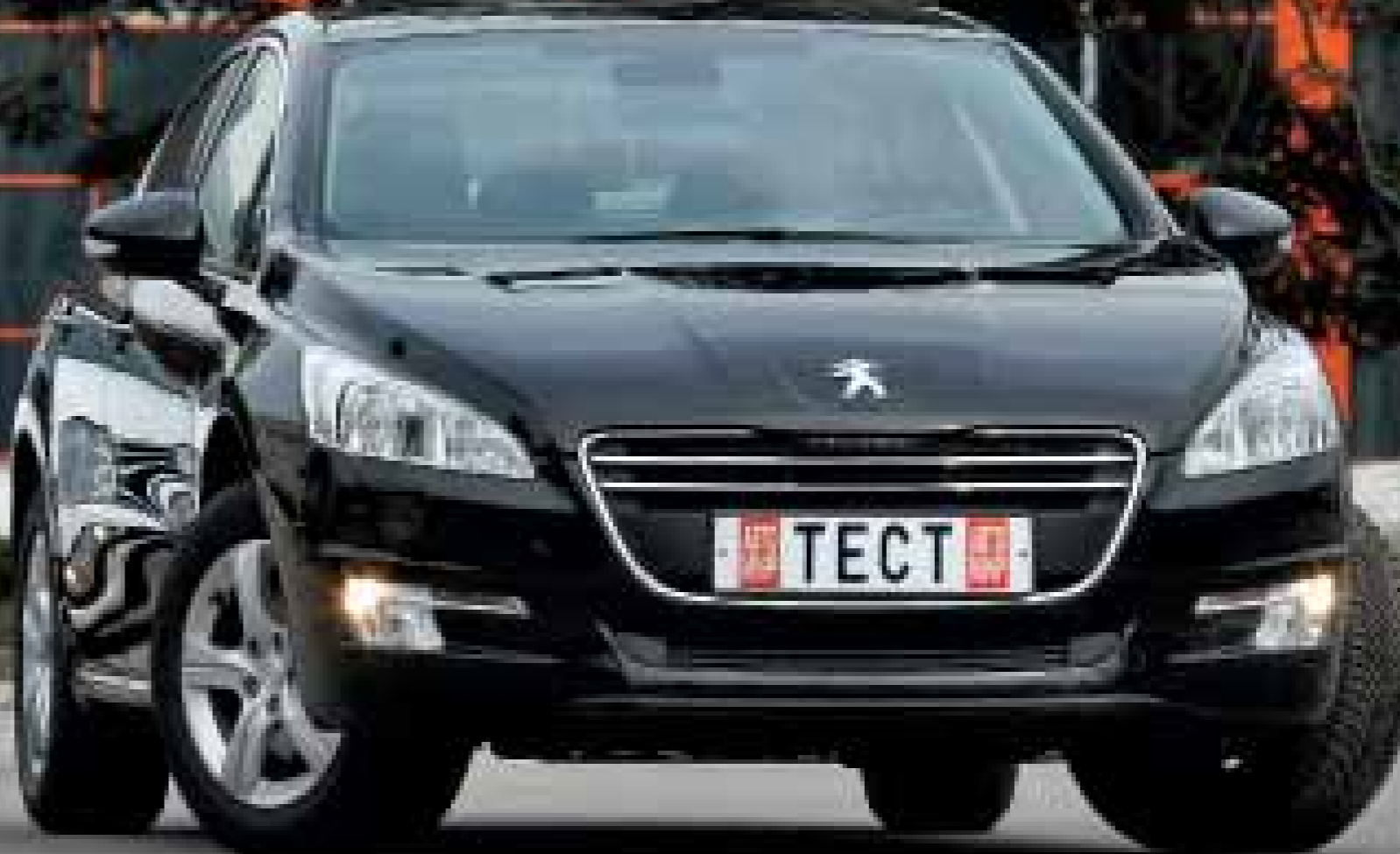
схемы: С. СТЕПАНОВ