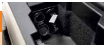
▲ Магнитолы всех без исключения версий дружат с флешками

У 508-го нет ручных коробок. Даже в базовом Access за $29 420, 120-сильному двигателю ассистирует «робот». Active (от $30 520) кроме упомянутого мотора позволяет выбрать 150-сильную «четверку» и дизель (136 л.с.). Они, в свою очередь, сочетаются с гидромеханическим автоматом. Оба агрегата служат и в Allure (от $36 520). Самый же мощный в семье 204-сильный дизель возит самую дорогую версию GT с ценником в $44 400.