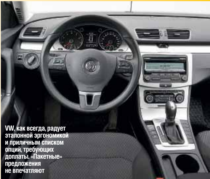
VW, как всегда, радует эталонной эргономикой и приличным списком опций, требующих доплаты. «Пакетные» предложения не впечатляют

дизелем, датчиком дождя и автоматически затемняющимся зеркалом в салоне. Цена на Highline стартует от $35 656 за машину с мотором на 160 л.с. Кроме того, в самой дорогой версии можно получить 3,6-литровый V6 на 300 л.с и 2-литровый TSI мощностью 210 л.с.