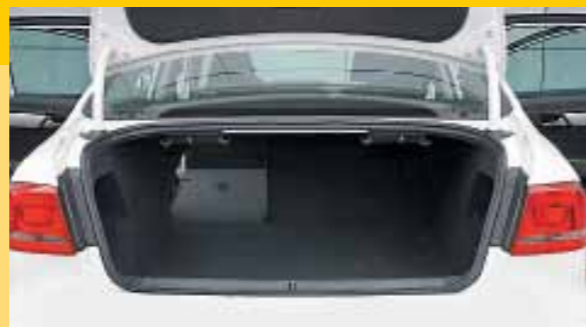
▲ В педантичном немецком седане даже багажник строгой геометрической формы, а не очень крупные вещи можно сложить в боковые ниши ▼ Специальные ручки позволяют складывать спинки дивана непосредственно из багажника

а четкий и упругий руль будто сам ведет автомобиль заданным курсом. В то же время амортизаторам и пружинам хватает сил на то, чтобы бороться с серьезными кренами в виражах, а усилие на «баранке» дает ясное представление об углах поворота колес и потере их сцепления с асфальтом. И хотя французский седан никак не может скрыть, что чрезмерно активные действия его слегка напрягают, водить эту машину вкусно. Турбомотор наделяет 508-й адекватной для его статуса динамикой. В то