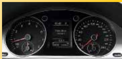
▲ Приборы идеально читаются, а бортовой компьютер обучен русскому языку