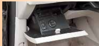
▼ Кнопки ESP и проекционного дисплея на выдвигном пульте