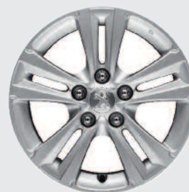
Диск алюмінієвий 16" стиль 1