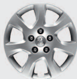
Металевий диск 16" стиль «А»