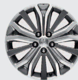
Диск алюмінієвий 18" стиль 2