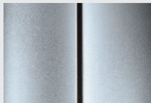
Сірий (Gris Cool Silver)