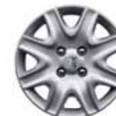
Колпак Brisbane 15"