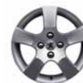
Колёсный диск Canberra 16"