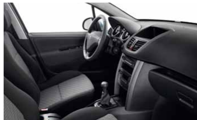
Вариант отделки салона с тканевой обивкой (SPA Noir Mistral) Базовый вариант для хетчбэка Premium