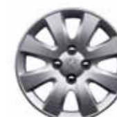
Колпак Hobart 15"