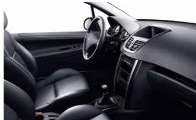
Вариант отделки кожаного салона (Noir Mistral) (Опция*) Для хетчбэка – в зависимости от версии автомобиля

* Кожаные элементы обивки передних сидений: верхняя передняя часть спинки, передняя поверхность подголовника, внутренние края боковых упоров спинки и подушки – гладкая кожа. Верх подушки, средняя и нижняя часть спинки – перфорированная кожа. Задние сиденья: верхняя часть спинки, передняя поверхность подголовника, спинка и подушка центрального места, внутренние края боковых упоров спинки и подушки – гладкая кожа. Верх подушки, средняя и нижняя часть спинок боковых сидений – перфорированная кожа.