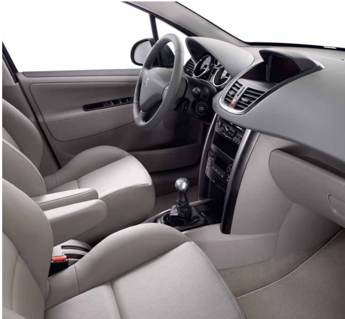
Кожаный салон Cuir Perforé Grège (Опция*)

* Кожаные элементы обивки передних сидений: верхняя передняя часть спинки, передняя поверхность подголовника, внутренние края боковых упоров спинки и подушки – гладкая кожа. Верх подушки, средняя и нижняя часть спинки – перфорированная кожа. Задние сиденья: верхняя часть спинки, передняя поверхность подголовника, спинка и подушка центрального места, внутренние края боковых упоров спинки и подушки – гладкая кожа. Верх подушки, средняя и нижняя часть спинок боковых сидений – перфорированная кожа.