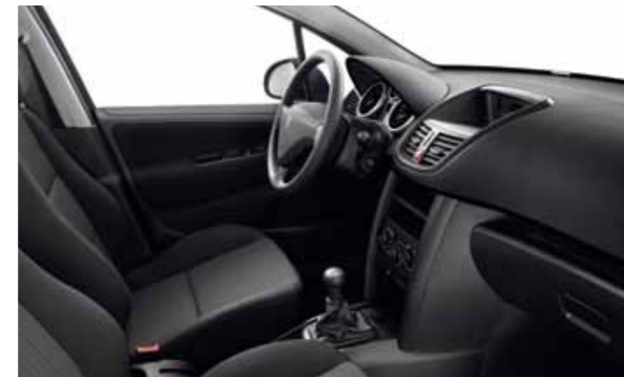
Вариант отделки салона с тканевой обивкой (Savana Noir Mistral) Базовый вариант для хетчбэка Urban