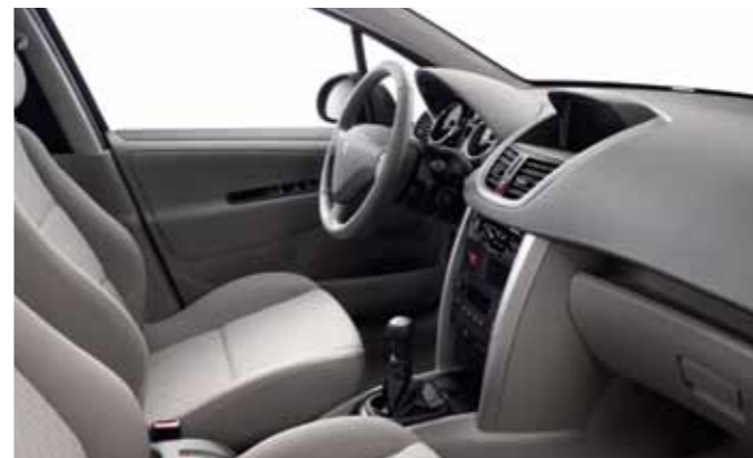
Вариант отделки салона с тканевой обивкой (SPA Grège) Базовый вариант для пятидверного хетчбэка Premium