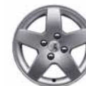
Колёсный диск Monaco 15"

Колпаки и колёсные диски доступны в зависимости от версии автомобиля.