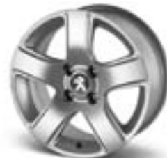
Легкосплавний диск Isara 16" Каталожний номер: 5402 Y4