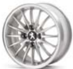
Легкосплавний диск Jet 15" Каталожний номер: 9607 W6