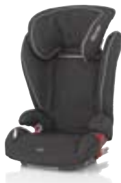
Romer Kidfix Група: 2, 3 Каталожний номер: 9448 18