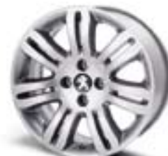
Легкосплавний диск Kapsiki 17" Каталожний номер: 9607 P0