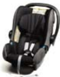
Romer Baby Safe + Група: 0+ Каталожний номер: 9648 E8

Протестовані та сертифіковані дитячі сидіння відповідають найсуворішим нормам безпеки (Європейська сертифікація ECE R44).