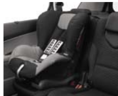
Romer Duo + Isofix 3 points Група: 1 Каталожний номер: 9448 15