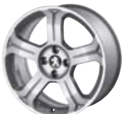
Легкосплавний диск Lincancabur 18" Каталожний номер: 5402 T2