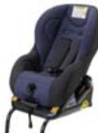
Fair GO/1 Isofix Група: 0, 1 Проконсультуйтеся у Вашого офіційного дилера.