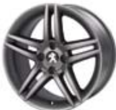
Легкосплавний диск Stromboli Dark 17" Каталожний номер: 9607 S4