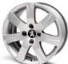
Легкосплавний диск Santiaguito II 16" Каталожний номер: 5402 FK