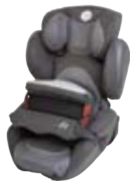
Kiddy Comfort Pro Група: 1, 2, 3