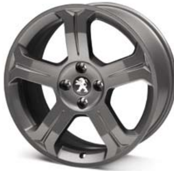
Диск Lincancabur II 18"