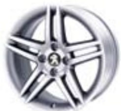
Легкосплавний диск Stromboli 17" Каталожний номер: 5402 Y0