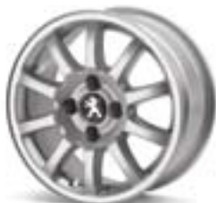
Легкосплавний диск Twenty First 15" Каталожний номер: 9406 H2