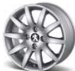
Легкосплавний диск Izalco 16" Каталожний номер: 5402 S9