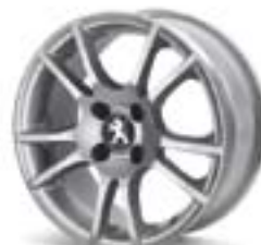
Легкосплавний диск Veleno 16" Каталожний номер: 9607 W8